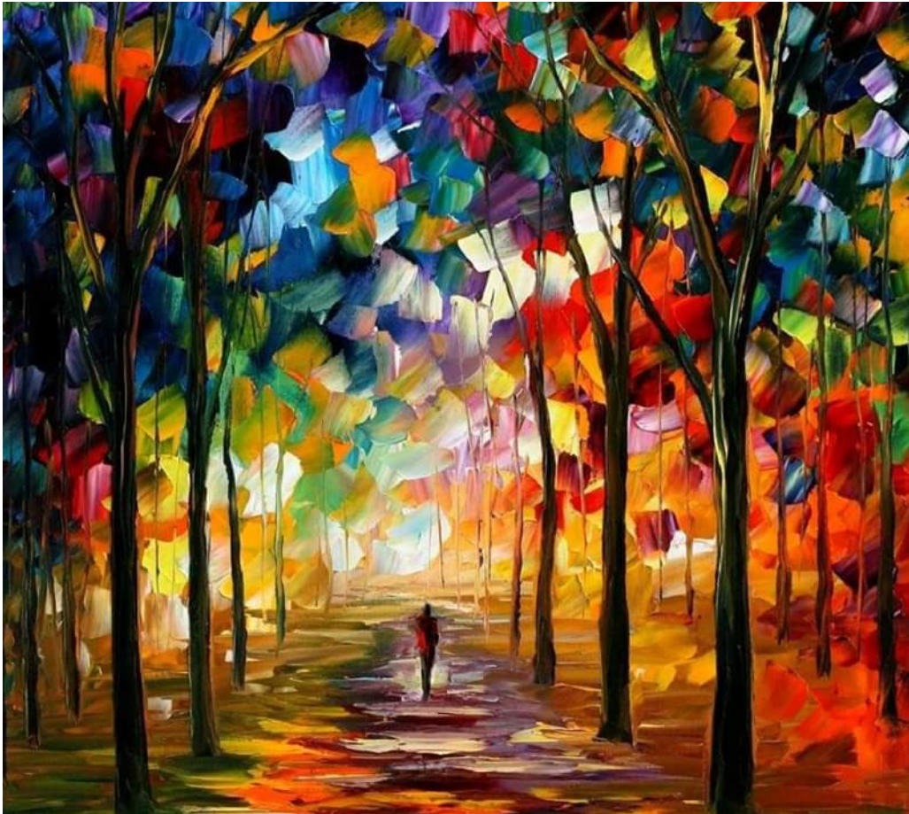
Leonid Afremov – Forest Path